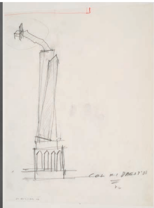
Melvin CHARNEY, Dessin d'étude, jardin du CCA , 1988. Mine de plomb sur papier calque avec crayon de couleur rouge. 28,9 x 21,6 cm. Collection CCA. Don de Melvin Charney. © Melvin Charney/SODRAC 2012.