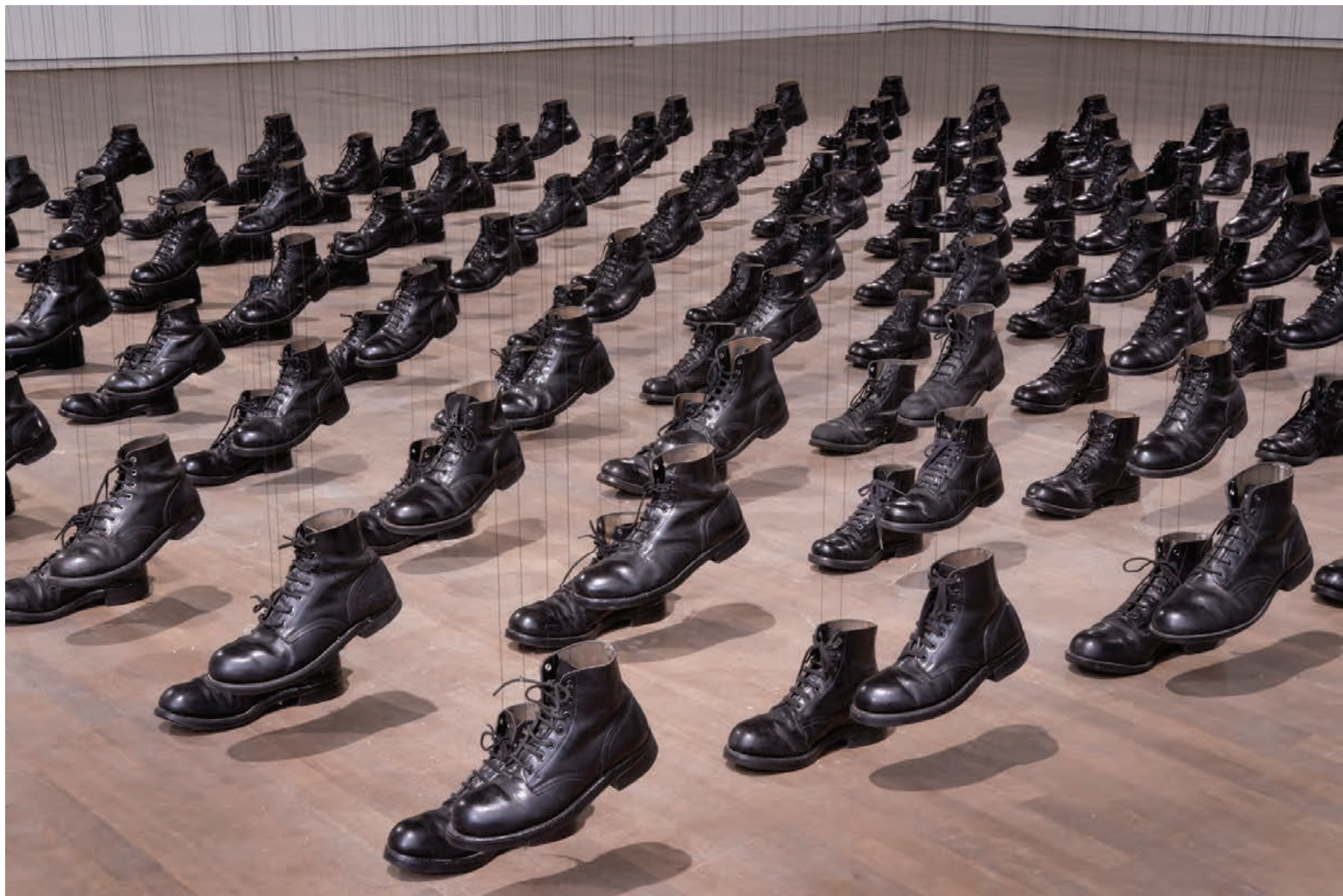
Dominique BLAIN, Missa , 1992. Détail. Cent paires de bottes militaires usagées suspendues à une grille par des fils de nylon noir. Carré d'art contemporain. Collection du MBAM.