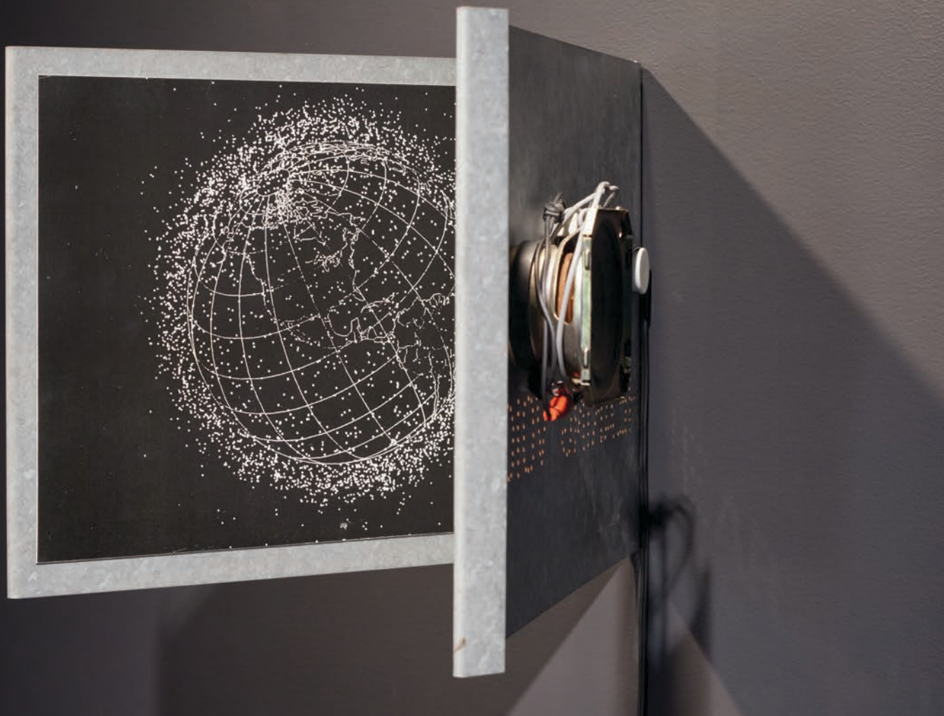
Martin TÉTREULT, Phonographes vinylisés , 2012. Détail de l'installation.