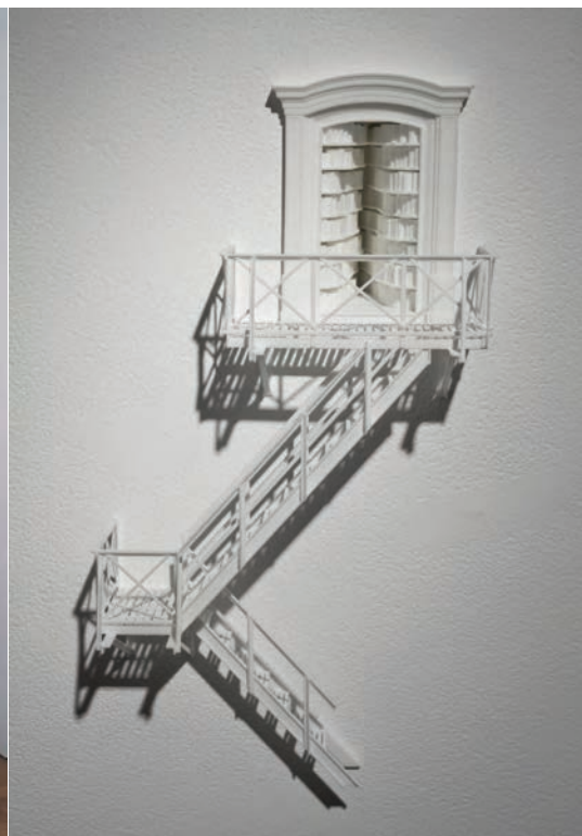
← Guillaume LACHAPPE, Évasion , 2010. Impression 3D, plâtre, époxy/3D printing, plaster, epoxy. 27 x 18 x 18 cm. Édition : 5.