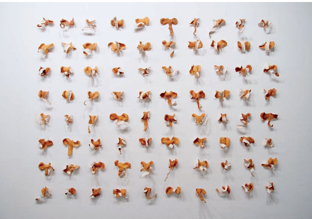
Angie HOSTETLER, Orange elephant (now we're friends) , 2009. Pelures d'oranges. Dimensions variables.