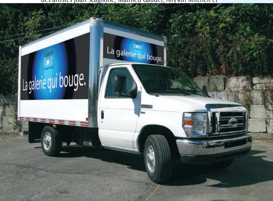
Gilles BISSONNET, La Galerie qui bouge , 2009.