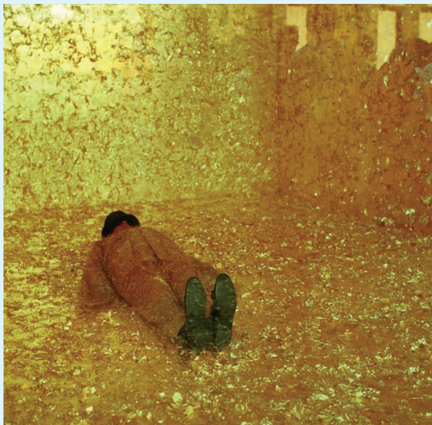
James Lee BYARS, Performance pour le vernissage The Death of James Lee Byars à la Galerie Marie-Puck Broodthaers, Bruxelles, 1994.