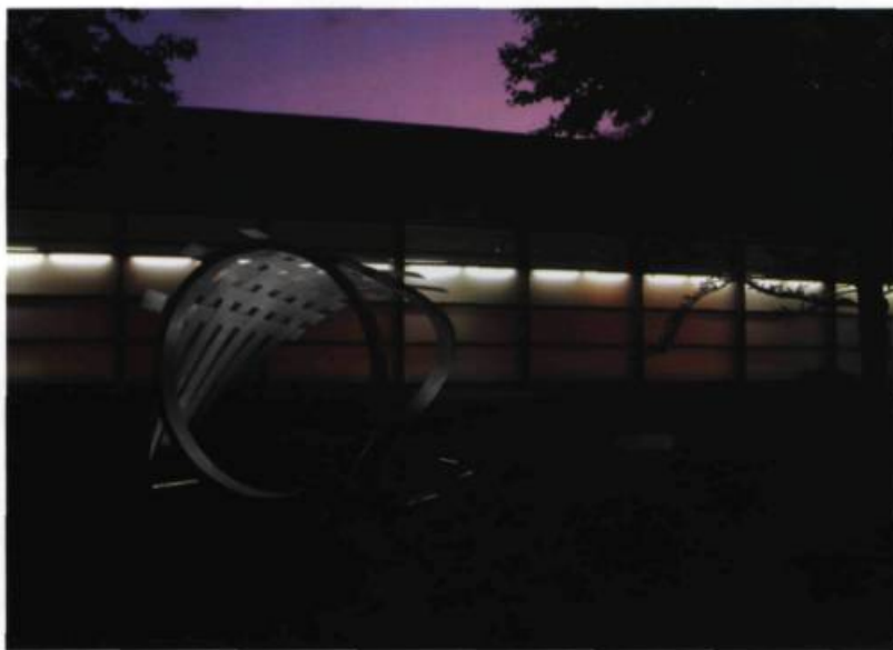
Francine LARIVÉE, Le cadre où toute chose se cherche , 2008. Aluminium brossé/Brushed aluminium. 2,6 x 8 x 4,5 m. Centre national de biologie expérimentale (CNBE), Laval.

Art and political power maintain links that, according to the times, take