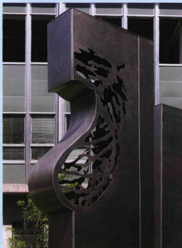
Pierre LEBLANC, Naissance, envol et vie... un cycle ou Pour la suite du monde , 2009. Détail/Detail. Acier inoxydable, lumière/Stainless steel, light. 5,6 x 15,2 x 12,1 m. Université Laval (Québec), Pavillon de médecine.