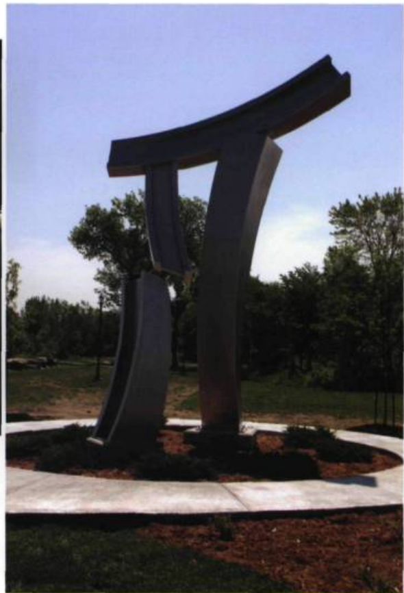
Claude MILLETTE, Le coup de départ , 2009. Acier inoxydable/Stainless steel. Parc Philippe-Laheurte, Saint-Laurent.