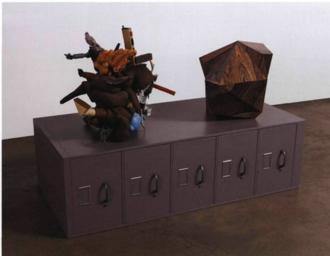
Valérie BLASS, Deux assemblages crédibles à partir de mon environnement immédiat , 2007. Plancher flottant, classeur, plâtre, pigment et objets divers. 106 x 150 x 71 cm. Avec l'aimable permission de Parisian Laundry, Montréal. Photo : Guy L'Heureux.