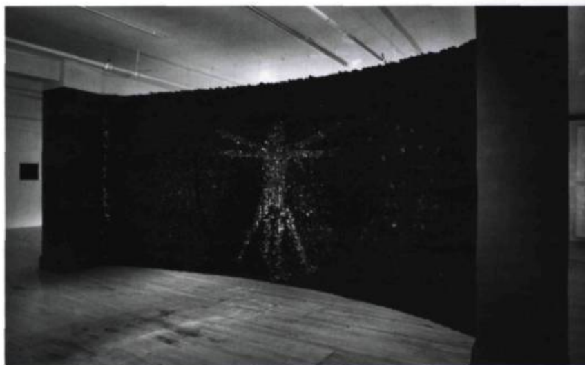
Lisette LEMIEUX, Scopie , 2007. Pellicules radiographiques.

nomiques, elle évite l'écueil de la récupération et apporte un angle de vue renouvelé qui suscite une