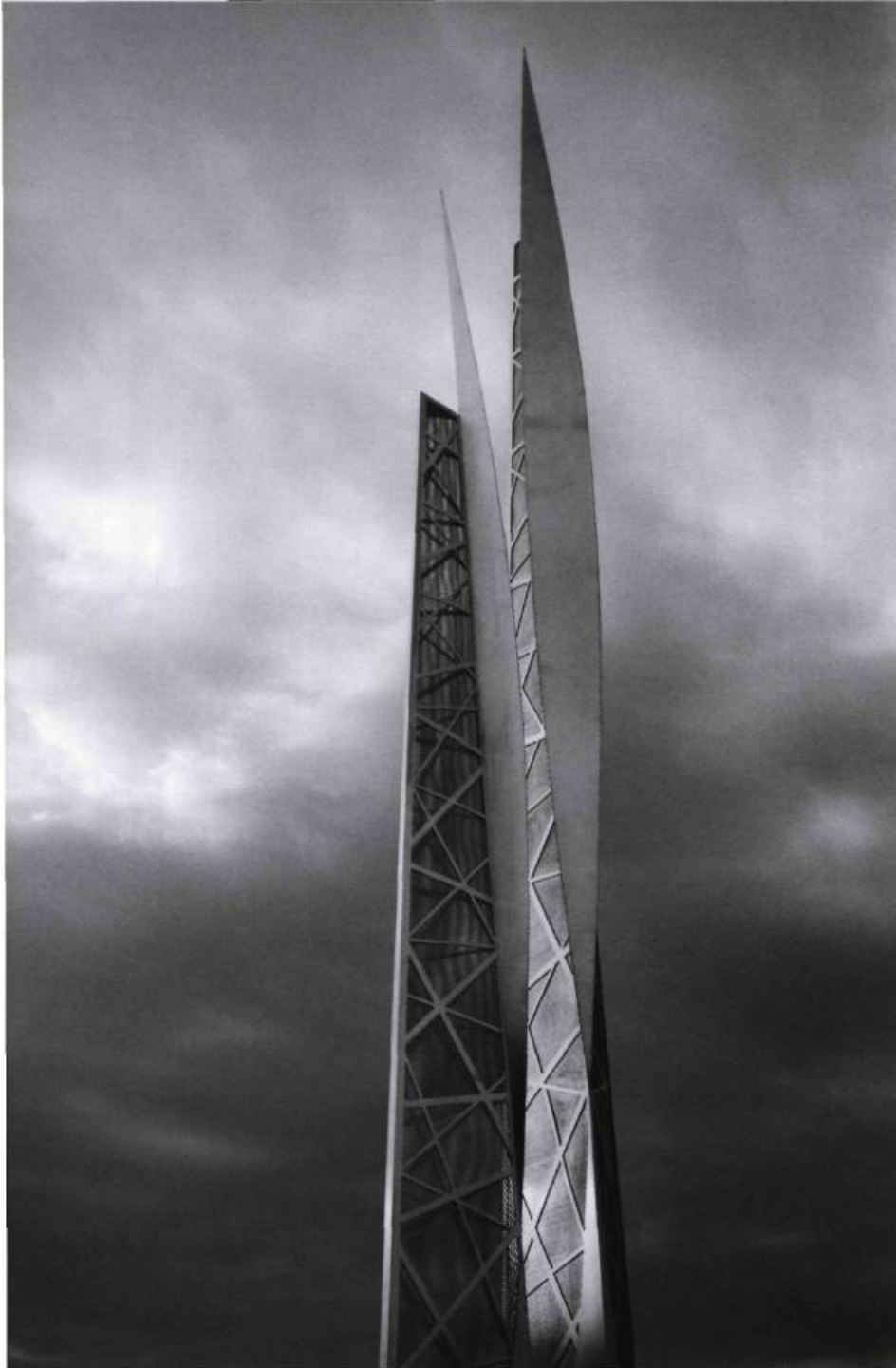
Jacek JARNUSZKIEWICZ, L'homme est un roseau pensant 3 , 2007. Acier inoxydable. Hauteur : 12,19 m.