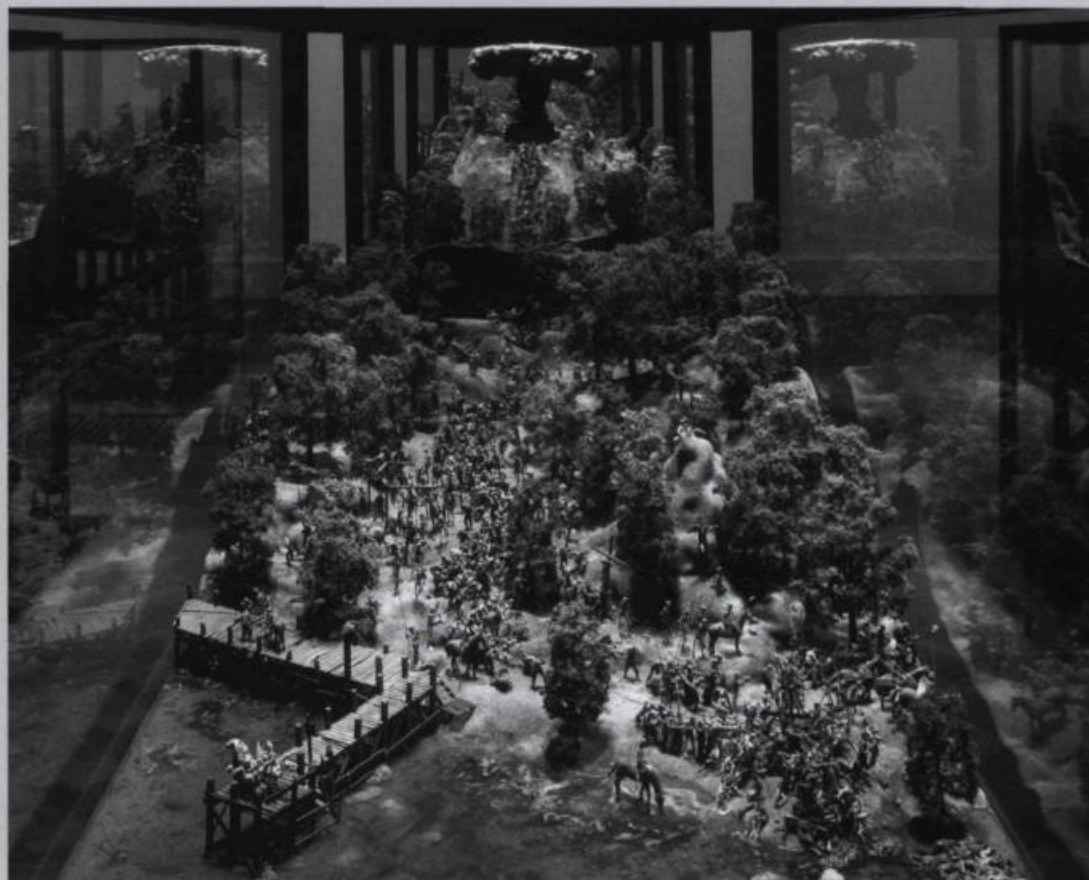
Jake and Dinos CHAPMAN, Hell (détail), 1999-2000.

ality. It would be more accurate to say that in this series, the sculpture oozes abjection from every side and in every direction. In Fuckface Twin of 1995, for example, the artists created a mutant mannequin straight out of a bad erotic science-fiction film—a kind of Siamese twins attached from head to trunk, with two arms and three legs. These Siamese mutants are similar to prepubescent children without genitals but with a nose in the shape of a penis and a mouth in the form of an anus. They are made of Fiberglas and wear a real wig and Nike running shoes. The result is a hyperrealist sculpture of an improbable being. This improbability is not total since the sculpture causes unease rather than simple hilarity. In part, this uneasiness is generated by widespread fear of genetic experiments and stem cell research. The hyperrealist aspect of the modelling and the use of real sports shoes and wig intensify the impression of an almost tangible reality and thus increase the degree of anxiety. In other words, these mannequins have something too human and real about them to be simply ridiculous virtual figures. When there is laughter, it is constrained and anxious