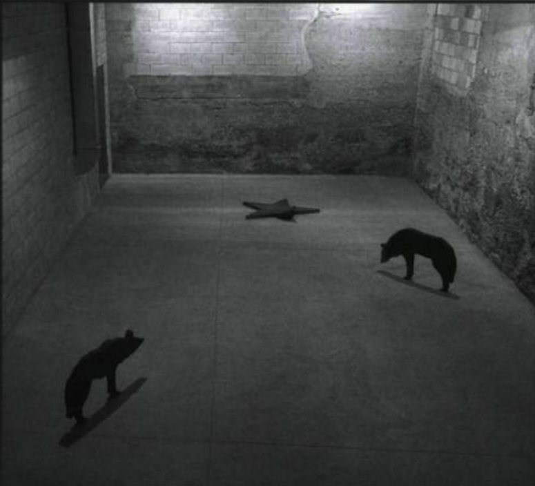
← John McEWEN , Rising and Falling , 2003. Exposition Archipel , Parisian Laundry, Montréal.