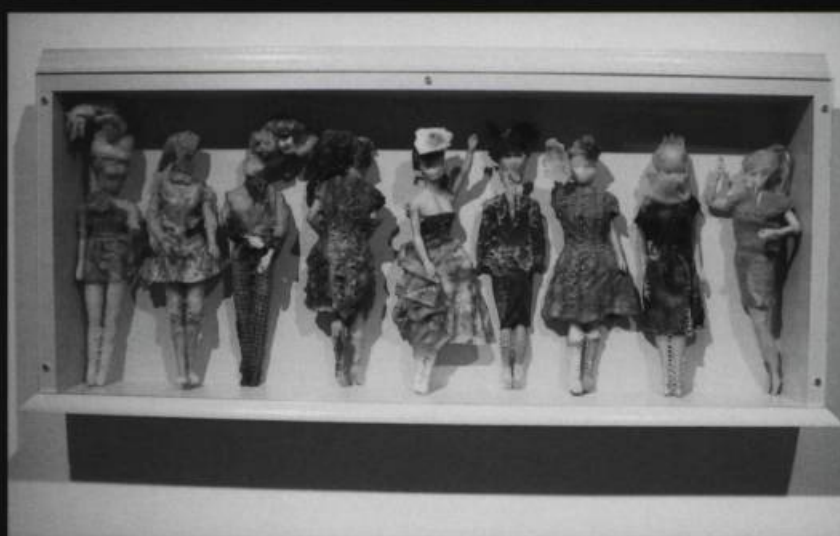
Aganetha DYCK , Pivot , 2006. Poupées, boîte de bois. 90 x 40,5 x 10,5 cm.