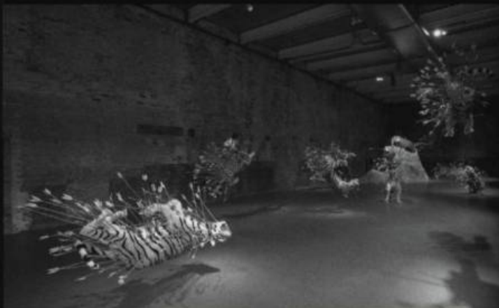
Cai GUO-QIANG , Inopportun. Stade deux , 2004. Techniques mixtes.