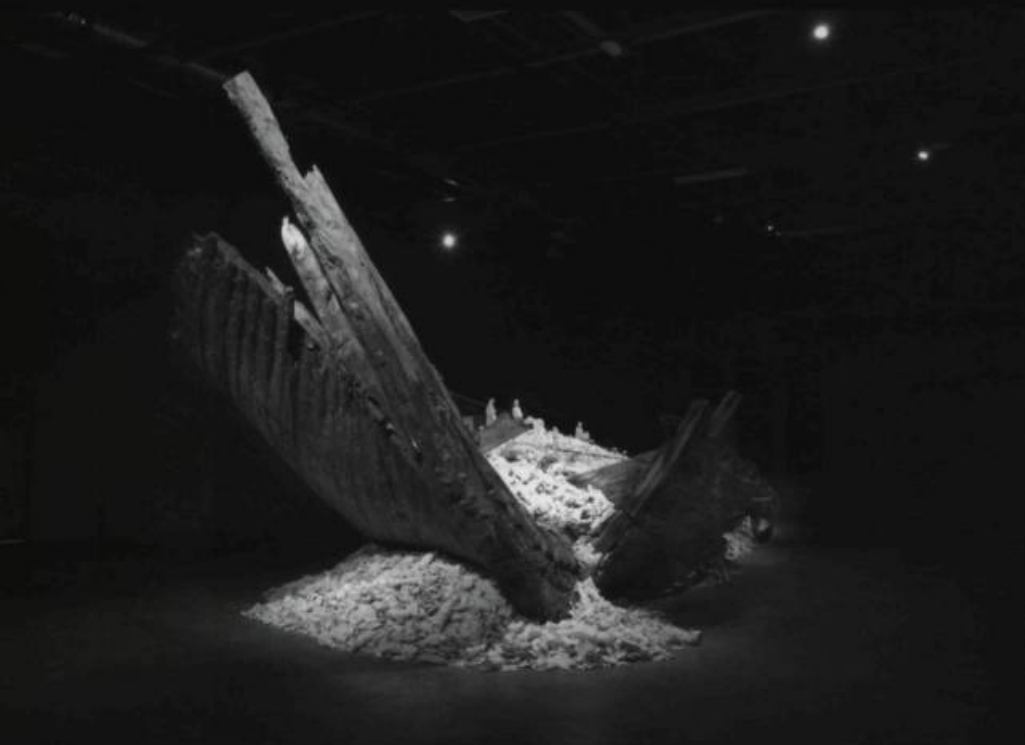
CAI Guo Qiang , Reflet – Un don d'hwaki , 2004. Ancien bateau de pêche en bois et tessons de porcelaine. Dimensions variables. Collection de l'artiste.