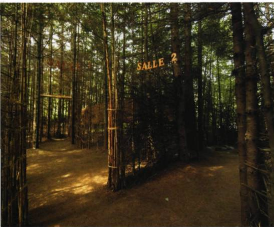
Danielle LAGACÉ, Le petit théâtre de Marie , 2005. Installation. 8 e Symposium international d'art in situ : Amérique baroque / Barocca America.