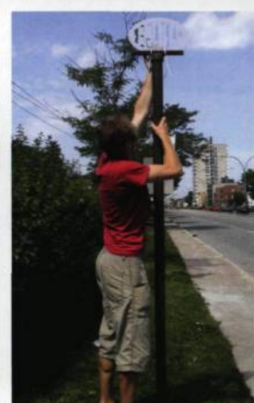
Rose-Marie E. GOULET, Nos frontières , 2005. Interventions au square Viger (Montréal) et ailleurs dans la ville / Interventions in Square Viger and elsewhere in Montreal.

agrémenté de plantes en cascades, de plans d'eau et de fontaines, le site – particulièrement raté et déprimant avec ses masses écrasantes de béton – est plutôt redevenu le no man's land qu'il a toujours été, envahi par les itinérants, les robineux et les toxicomanes. C'est dans ce « havre » excentrique – en voie d'être complètement rénové, apprenait-on en septembre dernier – que Goulet a posé les premiers jalons de son intervention à plusieurs volets où s'imbriquent actions et objets. À différents endroits du parc, elle a disséminé des photographies sur lesquelles un mot se lisait plus ou moins clairement – disparaître, traverser, changer, infiltrate, share –, ainsi que des cartes et autres indices comme une bande sonore où des enfants récitaient studieusement des mots découverts lors de promenades dans la ville ( horaires et noms de magasins, noms de rues, affiches publicitaires... ).