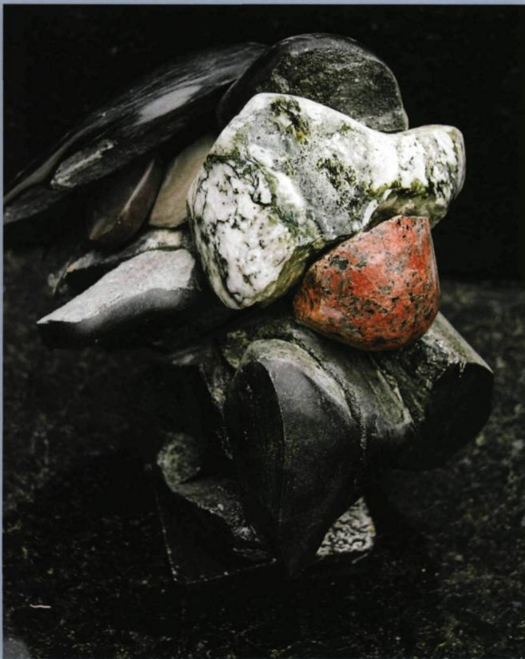
Sylvain POTVIN, L'entre deux temps , 2005. Pierres / Stones.

This radical action – this way of taking us to the limits of a work – makes me think of I Love America and America Likes Me (1974), in which