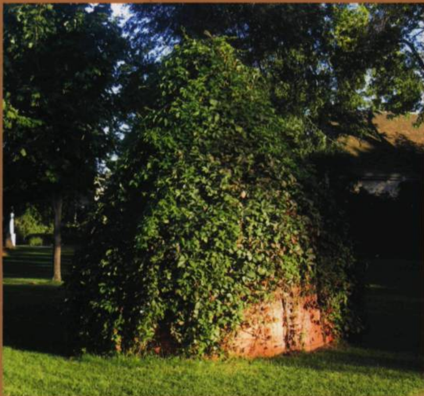
Agnès DUMOUCHEL, Albarelo , 1994. Terre cuite, acier, peinture, vigne / Terra-cotta, steel, paint, vines . H. : 3,40 m. Dépôt de l'artiste / Artist depot. Musée plein air de Lachine : secteur Musée. Photo :