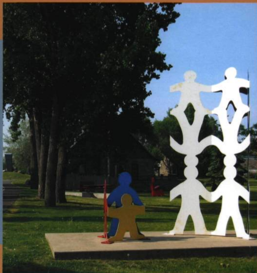
Gilles BOISVERT, L'arbre des générations , 1987. Acier peint / Painted steel. H. : 3,66 m. Don de monsieur Simon Garcia. Œuvre acquise dans le cadre de l'Année internationale de la famille. Musée plein air de Lachine : secteur Site du Musée.