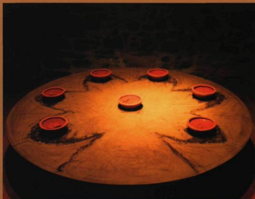
Agnès DUMOUCHEL, Bols d'orifices humains , 1994. Modelages : terre cuite / Modelling : terra-cotta. H. : 7 cm ; diam. : 19,5 cm chacun/each. Collection de l'artiste.