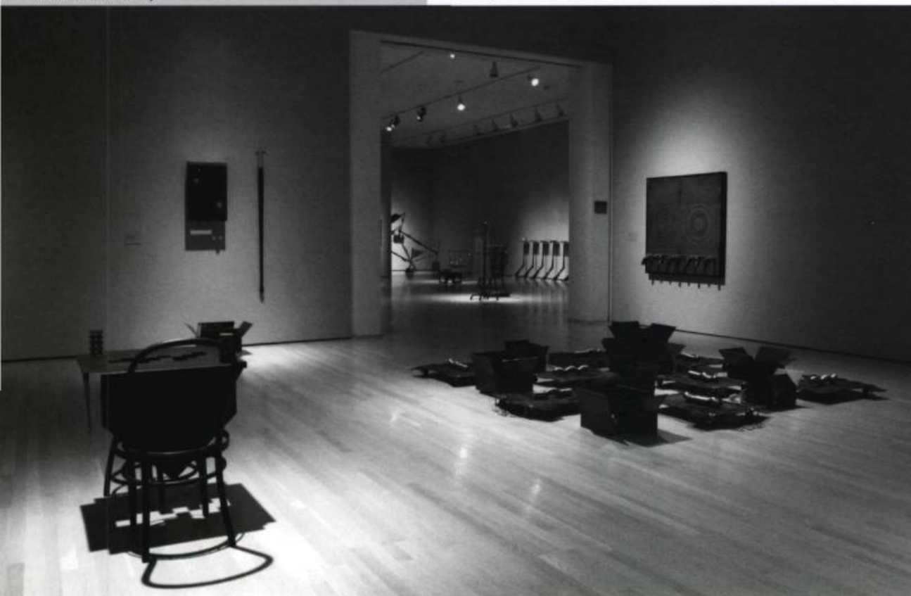
Michel GOULET, Les Pièges de l'esprit , 1996. Acier patiné et laiton. 84 x 60 x 111 cm. Collection Luc LaRochelle. À l'arrière-plan au sol : États des directions , 1990. Acier et objets. 30 x 305 x 305 cm (variable).