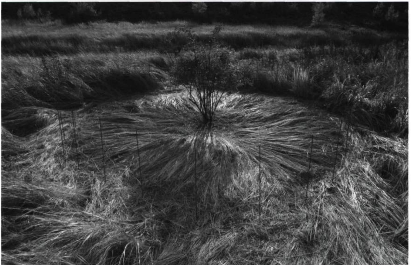
Fernande FOREST, Je rose, je bleu, je fleur dans tes yeux , 2004. Rosier palustre, grelots, spartine pectinée, goujons de bois peints et fruits du rosier.

Quoi qu'il en soit, toute l'entreprise ne manquait pas de cohérence sur le papier, et les résultats sur le terrain étaient souvent plus que satisfaisants. Glissons sur la proposition évolutive de Larivée — bien ficelée, comme d'habitude, dans sa façon d'entrecroiser les complicités scientifiques, les intentions écologiques et la dimension proprement poétique —, prometteuse mais qu'on ne pourra vrai-