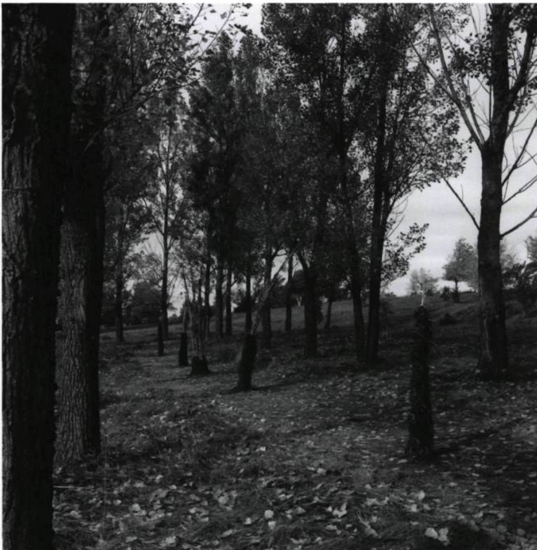
Julie FORGUES, Histoire silencieuse , 2004. Plants de maïs et algues.