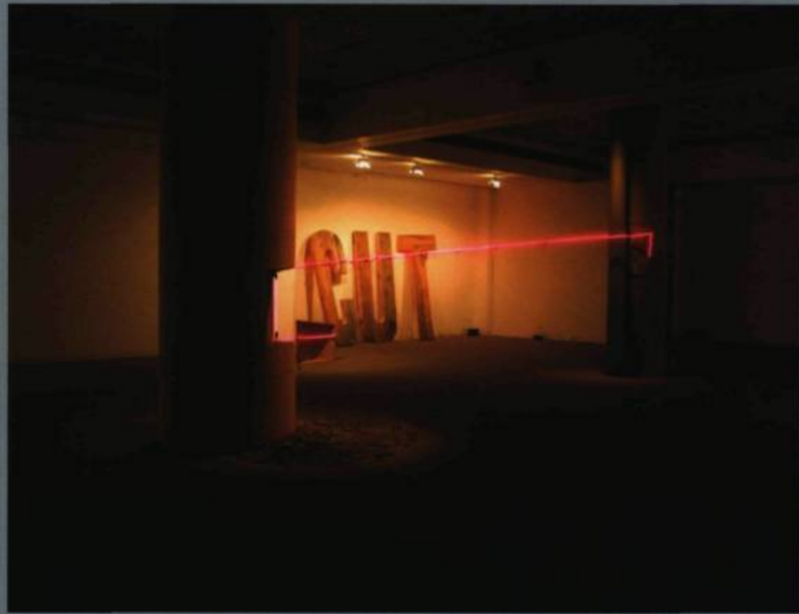
Peter GNASS, C for Cut , 2004. Fil de nylon.