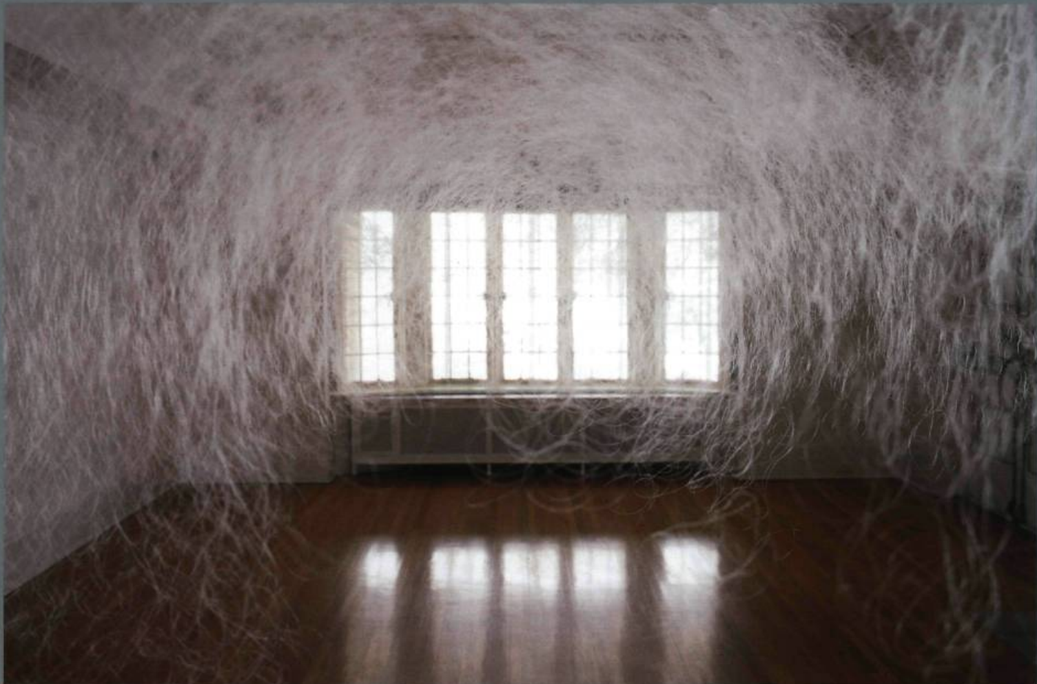
Karilee FUGLEM, Untitled (Invisible Thread) , 2003. Fil de nylon. Prêt de l'artiste, avec la collaboration de Pierre-François Ouellette art contemporain.