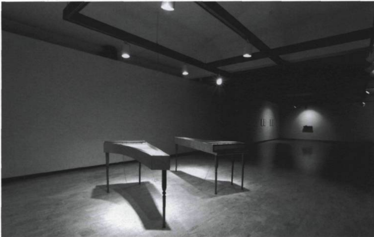
MICHAEL MARANDA, Decoy , 2002. Detail. Harpsichords, headphones, ink on paper, soundtrack. Dimensions variable.

tion marks in the precise places that they are found in the original text, and choosing quite specifically this particular text, he nonetheless claims, only to erase, the philosophy of the book. On the one hand, he renders the text as image, and on the other — where he leaves only the corrections in Wittgenstein's Tractatus —, the futility of attempting to make sense