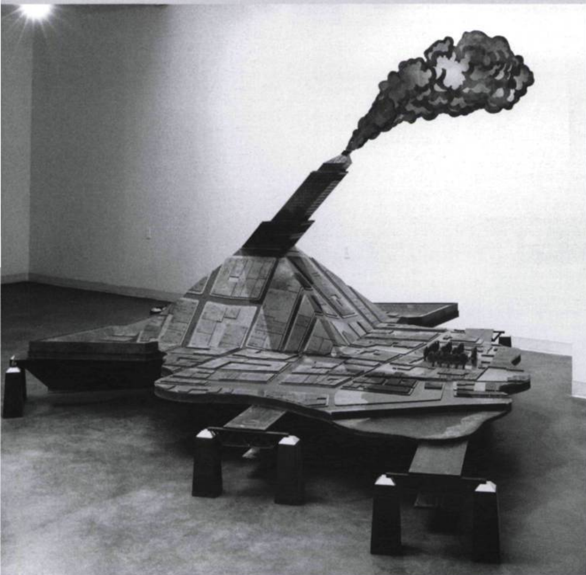
PIERRE GRANCHE, Ombre portée sur la cité , 1988. Bois, acier. 2,4 x 2,4 x 2,4 m. Coll. Musée d'art de Joliette.

Quoi qu'il en soit, « Guido » restera pour tous ceux qui l'ont approché « le théoricien du molinarisme », comme il se définissait déjà lui-même en 1954 avec un demi-sourire. Cinquante ans plus tard, on comprend mieux qu'il ne s'agissait pas d'un mouvement pictural parmi d'autres, mais d'une façon de vivre pleinement tout en étant artiste. Tout simplement. Adieu, Moli ! ←