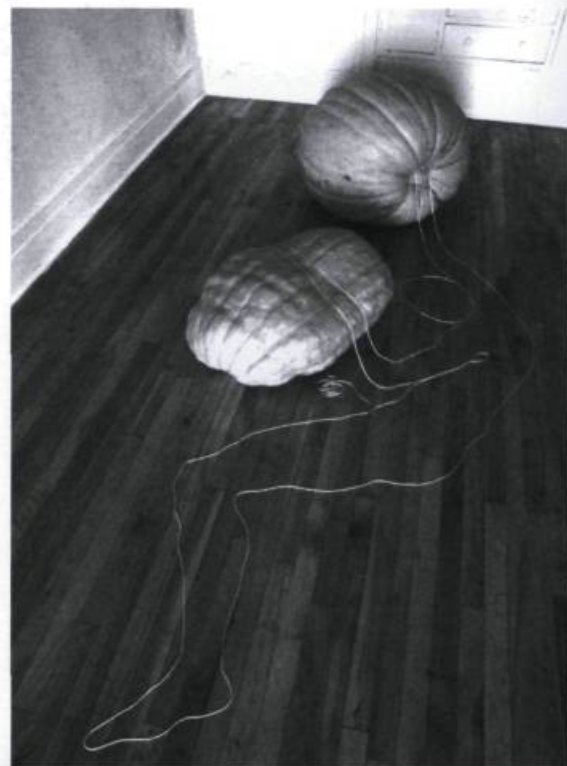
KRISTINE FRIEDMANN, Sans titre , 2002. Ficelles, citrouilles. Env. 2 m de longueur.

Nous quittons les lieux, laissant la clé dans la boîte aux lettres pour les prochains visiteurs. ←