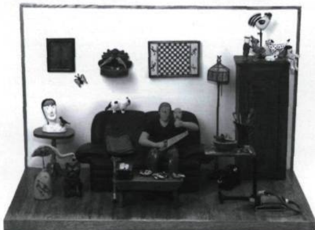
QUINZE, Quand l'atelier devient l'œuvre , 2002.