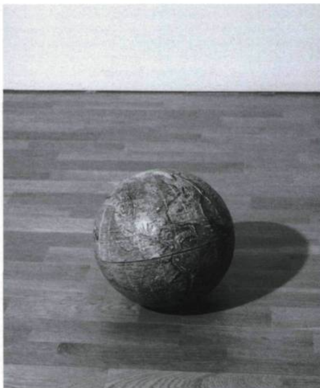
DANIEL OLSON, Strike Anywhere , 1998. Allumettes et bouchon de bouteille. Édition de 3.