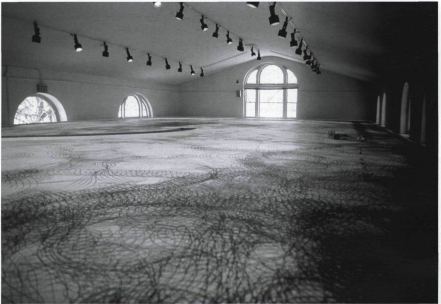
ALAN STOREY, Draw II: machine for drawing on the prairies , 1989. 2,7 x 9,7 x 16,7 m. Bois, toiles, plastique, véhicule motorisé, radio transistor, encre noire / Wood, canvas, plastic, motorized vehicle, transistor radio, black ink.