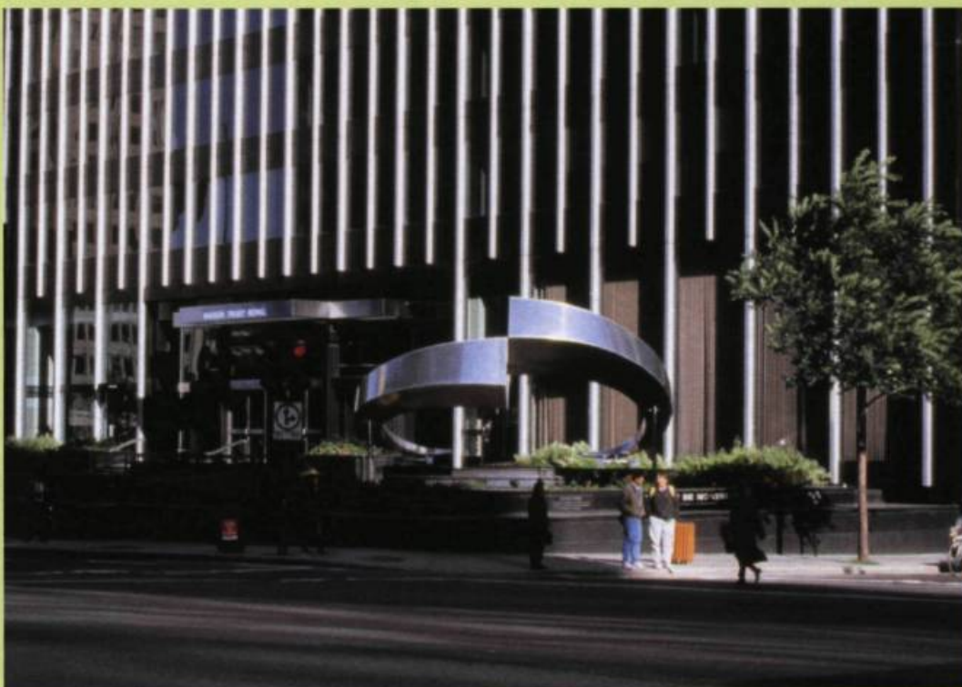
ALAN STOREY, Urban Language , 1992. Aluminium, acier inoxydable, système hydraulique, sons (voix ambiantes) / Aluminum, stainless steel, hydraulics, sound (voice / ambient). 3.6 x 5.4 x 7.3 m. Maison Royal Trust Plaza, Montreal.

Urban Language (1992), created for the Maison Royal Trust Plaza on Boulevard René Levesque in Montreal, remains one of Storey's most successful and succinct commissions. Its graceful aluminum and stainless steel forms, the gradual hydraulic movement upward and downward, and the dramatic site all add to the sculpture's shiny, urbane, almost futurist allure. The crescent-shaped parts of Urban Language are reminiscent of two of Storey's other sound-related works: Head Gear , a helmet with two hearing horns that took in environmental noise then reversed the sounds from the right ear to the left and vice