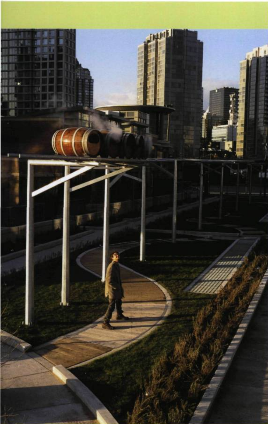
ALAN STOREY, Copper Mews , 2000. Détail. Acier, bois, béton, barils, tuyaux à vapeur, filage électrique. / Steel, wood, concrete, barrels, steam pipes, electrical wiring. Approx. 106 m. long. Concorde Pacific Development, Vancouver.