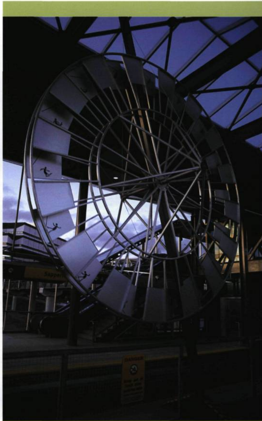
ALAN STOREY, Fluid Motion , 2001. Sapperton Skytrain Station, Vancouver.