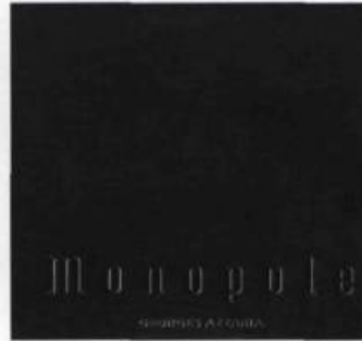
Monopole (Georges Azzaria), Ohm éditions, 2001.