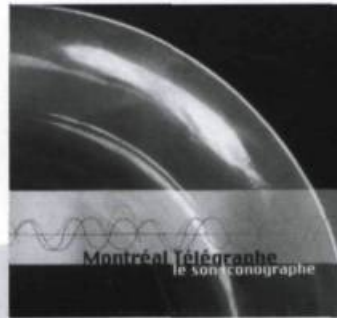
Montréal Télégraphe : le son iconographe, Chaostechnologie / Ohm avatar, 2000.