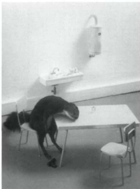
Maurizio Cattelan, Bibidabidiboo , 1996. Écureuil empaillé et médiums mixtes. 50 x 58 cm.

images de culture populaire, de jeux, de bandes dessinées et de films. Le jeu de Doley est une parodie du jeu de plateau conventionnel, pouvant être joué à cinq joueurs et proposant cinq personnages aux formes molles et abstraites, sans substance, ambition ou énergie. Des dessins, bandes dessinées, figurines, boîtes, règles, table, chaises et produits dérivés, aident les joueurs à sentir l'ambiance d'un jeu où les personnages amorphes doivent se battre pour survivre dans un système d'assistance sociale manipulateur.