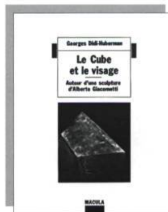
GEORGES, DIDI-HUBERMAN. Le cube et le visage. Autour d'une sculpture d'Alberto Giacometti. Macula, Paris, 1993, 243 pages.

À la suite de l'exposition Giacometti, présentée l'été dernier au Musée des beaux-arts de Montréal, quoi de plus normal que de vouloir entrer de nouveau dans l'intimité de cet artiste qui nous a laissé, à travers ses têtes sculptées et ses portraits dessinés ou peints, une œuvre obsessive et bien étrange — étrange parce qu'obsessive — eu égard à sa recherche initiale d'une présence incertaine, travaillée par l'absence. À la poursuite de cet «anthropomorphisme paradoxal»,