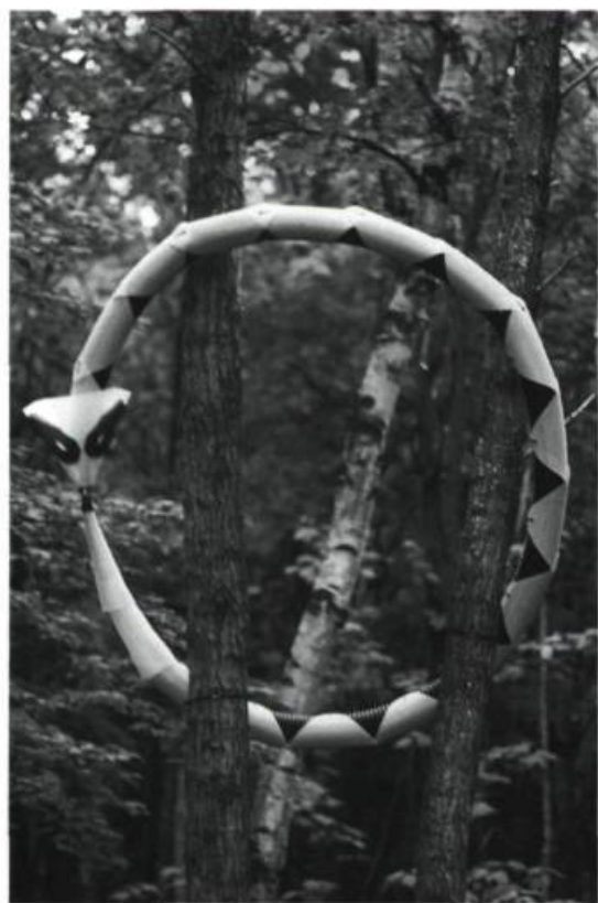
Richard Dautre, Ouro Boros , 1997. Fibre de nylon, plastique. 0,15 x 2 m. diam.