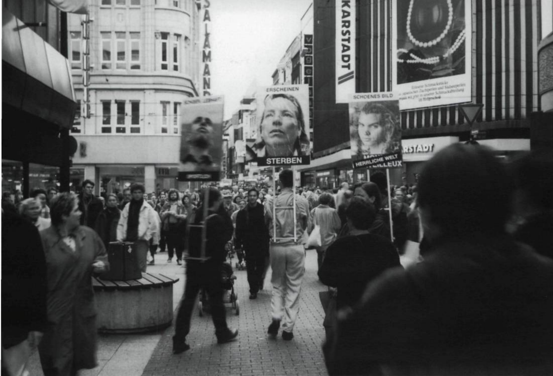
Attitude d'artistes, Images et propos mobiles , 1996. Hamburg. Photo : Daniel Garcia Andújar.

à Quartier Éphémère, c'est par le biais de deux bandes vidéos qu'il reprenait les images de leur intervention publique dans un décor où les murs de la galerie furent également requis de manière à en faire une immense affiche conforme au propos. En s'exposant ainsi sur les limites du système de l'art, en s'aventurant sur des sites nomades, voire même sur Internet 8 . AA confirme à sa manière ce que Nathalie Heinich appelle le «funambulisme» de l'artiste contemporain. 9 Il prend part à cette situation où l'artiste, comme acteur, investit de sa propre initiative le réseau de l'art contemporain en vue de construire et d'affirmer une identité d'artiste. La proposition Images et propos mobiles , en mettant en scène la question de l'identité sociale au sein de la société du spectacle, participe aussi de cet itinéraire. ■