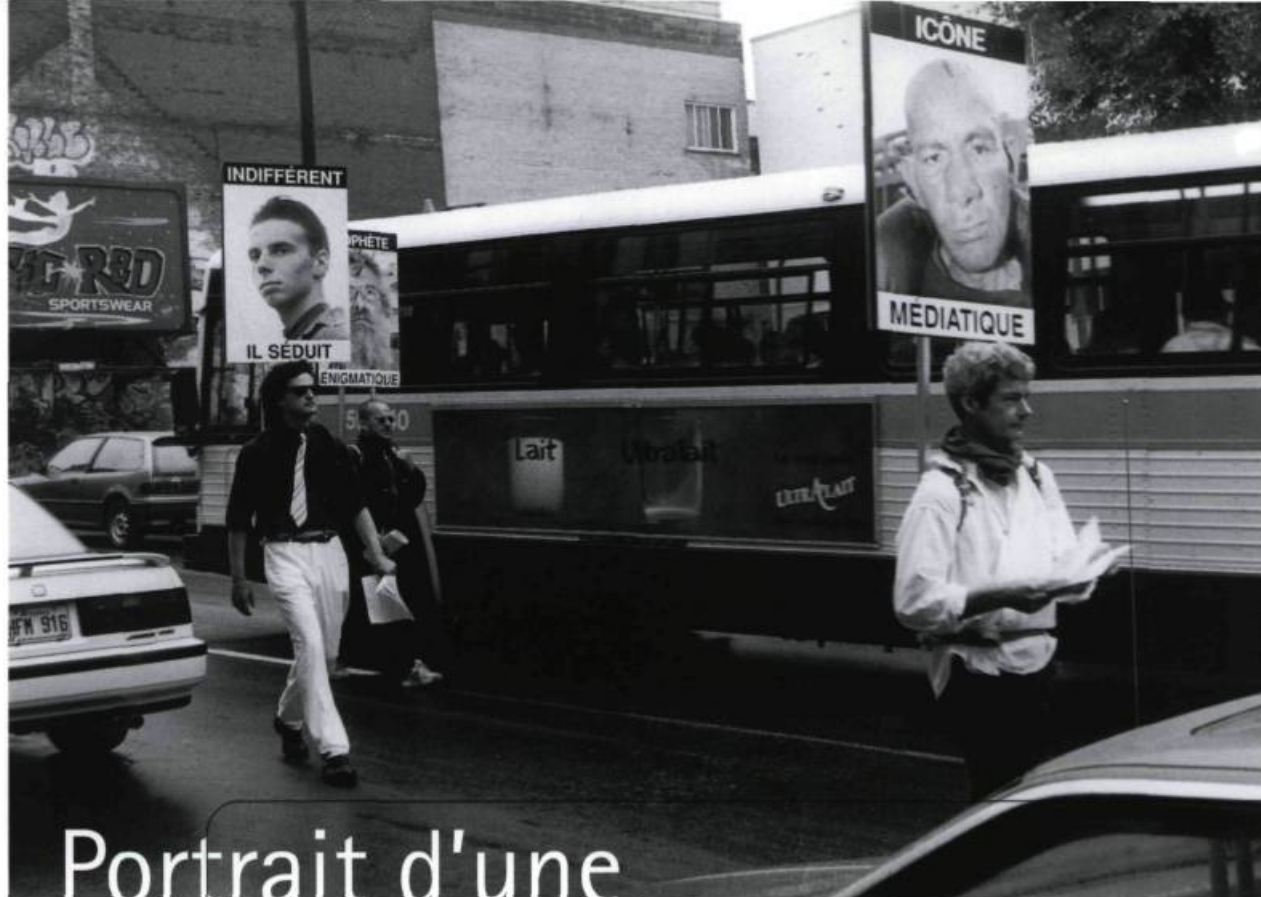
Attitude d'artistes, Images et propos mobiles, 1996. Montréal.