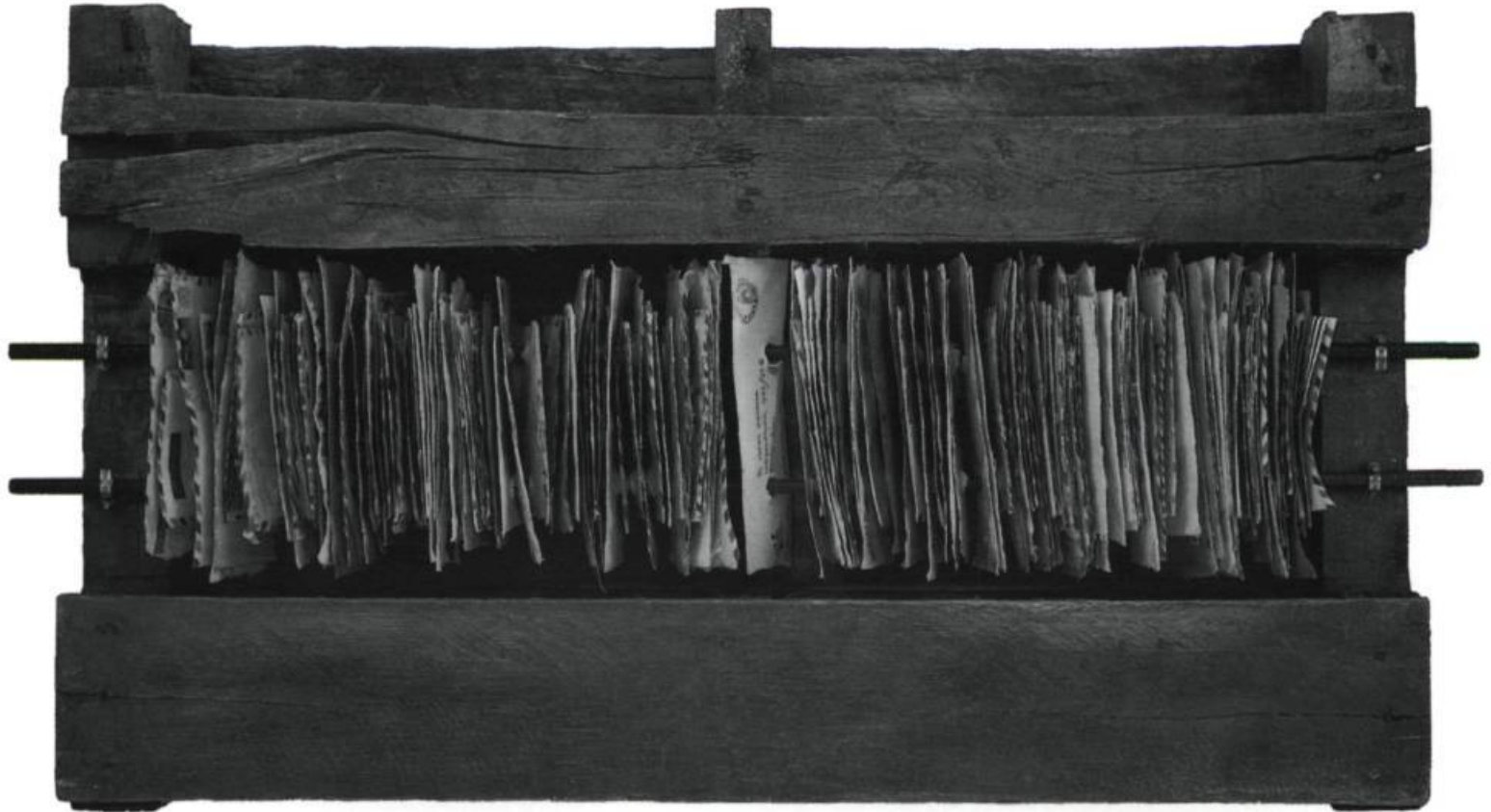
Carlos Gallardo, From Far Away , 1994. Bois, acier, papier, résine, acrylique. 59 x 102 x 16 cm. Galeria Der Brücke, Arte Internacional, Buenos Aires.

résine, sont rigidifiées ; effigies, mais aussi hommage rendu par Gallardo à leur auteur qui, vivant ou mort, est de toutes manières, ailleurs. On songe alors à la question évoquée par Didi-Huberman, soit «que serait donc un volume — un volume, un corps déjà — qui montrerait, au sens quasi wittgensteinien du terme, la perte d'un corps ? Qu'est-ce qu'un volume porteur, montreur de vide ? Comment montrer un vide ? Et comment faire de cet acte une forme — une forme qui nous regarde ?» 12 Voilà une forme qui nous fait signe, indice d'un réseau d'affinités électives constitué au hasard du temps et constitutif du soi. Se dissimulent pourtant aux yeux des spectateurs, et à ceux-là même de l'artiste, adresses et signataires de ces enveloppes, sans oublier bien sûr leur contenu, tout comme se perdent dans une nuit obscure les racines de notre mémoire affective. Se trouve ainsi réactualisée cette formule de Thierry De Duve pour qualifier le sentiment éprouvé face à une œuvre d'art : entité relationnelle , l'œuvre de Gal-