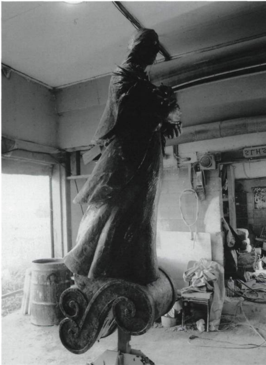
Les Industries Perdues. La vivrière, 1995. Sculpture- fontaine en bronze/Bronze sculpture-fountain. H. : 4,62 m. Place de la F.A.O., Québec. Collaborateurs principaux/Principal collaborators : François Hébert, Carmelo Arnoldin, Richard Purdy. Installation : Claude Bernard.

des choses, la seule issue possible est d'emprunter le visage de son ennemi, de refuser tout compromis et de fomenter des ruses infinies.