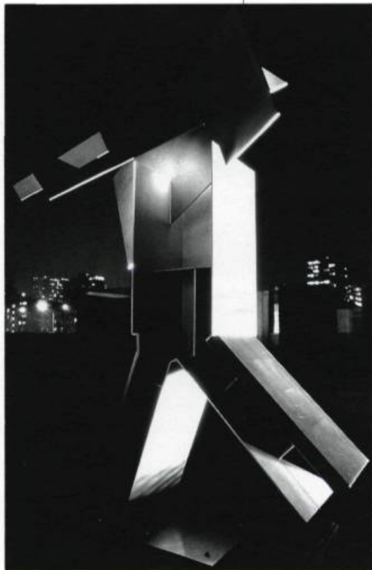
Melvin Charney, le Jardin du Centre Canadien d'Architecture, Montréal: vue nocturne de «La Tribune», l'une des dix colonnes allégoriques de l'Esplanade / Canadian Centre for Architecture Garden, Montréal: Night view of "The Tribune". One of ten Allegorical Columns erected on the Esplanade. Photo: Carlos Letona. Centre Canadien d'Architecture / Canadian Centre for Architecture.

En quittant le jardin, j'aperçois deux jeunes hommes assis à l'autre extrémité de l'enceinte. Ils font face à la ville, le dos tourné à Verdun