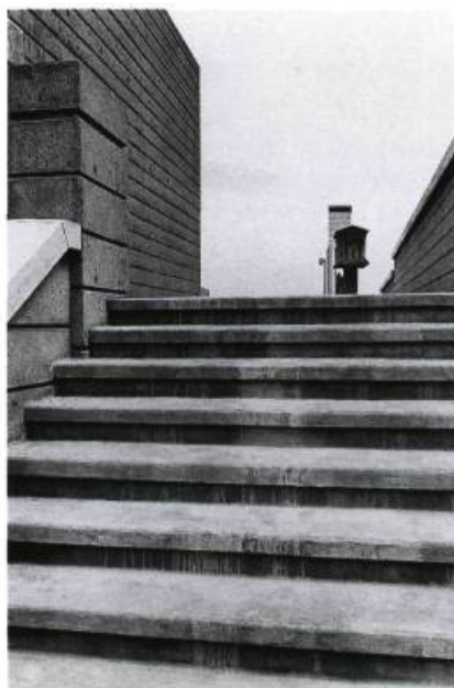
Le Jardin du Centre Canadien d'Architecture de Melvin Charney: vue depuis le nord montrant l'escalier ouest de l'Arcade et deux des dix Colonnes allégoriques de l'Esplanade. / The Canadian Centre for Architecture garden by Melvin Charney: Looking South, showing the Western Steps of the Arcade, and Two of the Ten Allegorical Columns on the Esplanade. Collection Centre Canadien d'Architecture / Canadian Centre for Architecture. Photo: Serge Clément.

Here is a place of disaffection Time before and time after In a dim light: neither daylight Investing form with lucid stillness Turning shadow into transient beauty With slow rotation suggesting permanence Nor darkness to purify the soul Emptying the sensual with deprivation Cleansing affection from the temporal. 2