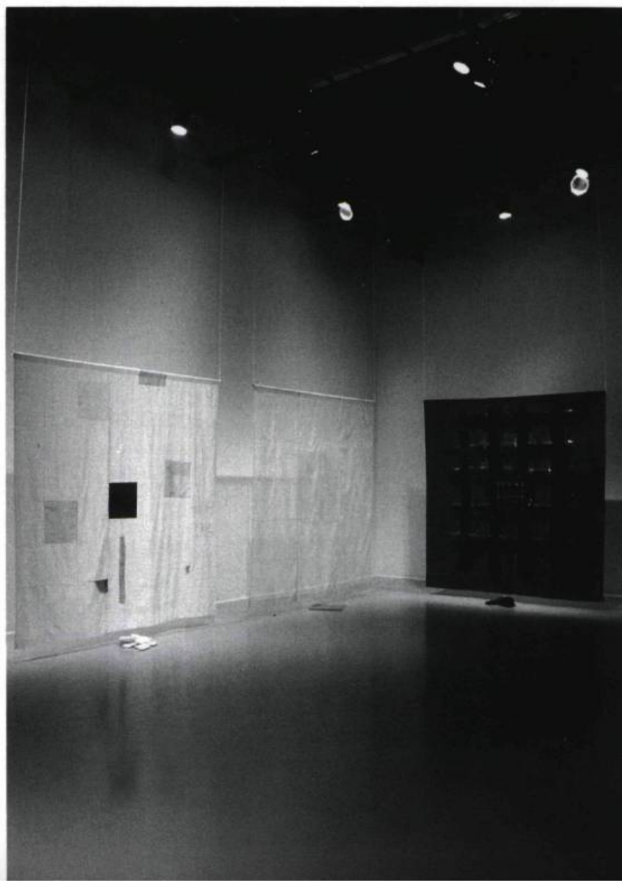
Claire Beaulieu, Voiles , 1993. Acrylique sur soie et objets au sol de velours, de coton et de soie. 244 x 244 cm/ch.

Ni au mur ni au sol, jouant à la frontière du sculptural et du pictural, ces surfaces diaphanes flottent en toiles vaporeuses dans un espace qu'elles habitent par volutes, comme pour s'excuser d'être là. Sensibles au moindre souffle, elles miment le travail de la peinture : délicatesses et fragilité cohabitent avec les arêtes d'une grille qui quadrille implacablement toute surface à peindre tra-