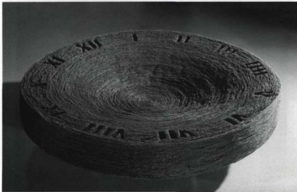
Lisette Lemieux, Entre matines et complies , 1993. Papier, métal et bois. 33 x 300 x 122 cm.