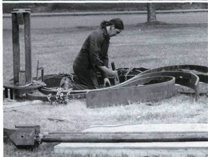
André Lapointe, L'île , 1993. Granit bleu de Suède, calcaire, roche des champs, 46 x 476 x 400 cm.