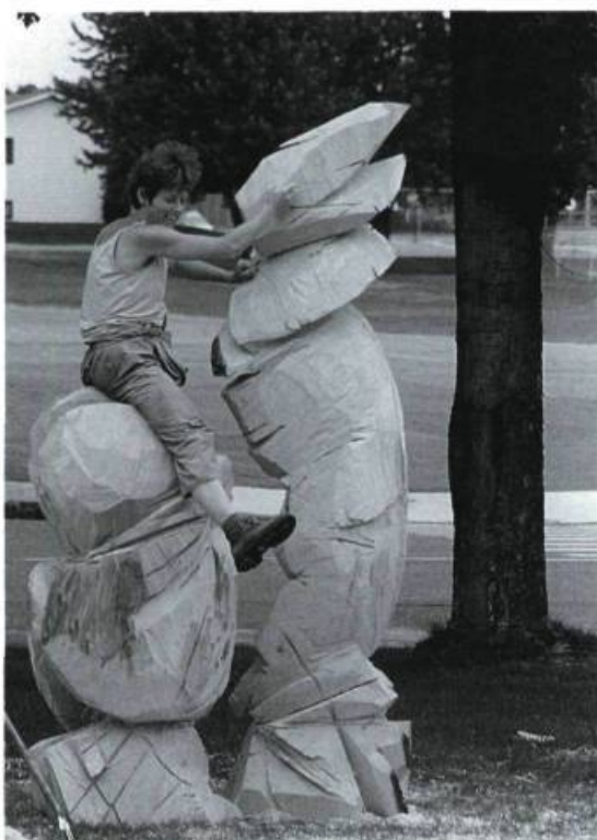
Éva Roucka, Avoir et Être , 1993. Bois: 233 x 114 x 68 cm.

à plusieurs égards. Ils ont aidé à faire connaître et comprendre la sculpture publique autrement que par le biais des monuments traditionnels érigés à la gloire des héros, permis à des municipalités d'acquiescer des oeuvres et ainsi accroître leur patrimoine culturel et ce, à des coûts relativement peu élevés. Quant aux artistes, c'est pour eux une occasion de sortir de l'isolement de l'atelier et aussi de pouvoir se confronter à des oeuvres de grandes dimensions, tout en partageant une expérience unique avec des confrères et d'autres professionnels, comme des ingénieurs ou des architectes du paysage. Un autre fait que l'on peut établir concerne le changement des mentalités quant à la réception des oeuvres. S'il est arrivé jadis que des sculptures ont été abandonnées sur place, détruites ou jetées à la rivière, de tels incidents n'ont plus cours aujourd'hui. Les élus municipaux et le public désormais ont davantage conscience de la valeur (culturelle et autre) des oeuvres que les sculpteurs laissent et ils tentent justement de les mettre en valeur et de les "protéger" : une prise de conscience sur le plan de la culture qui va