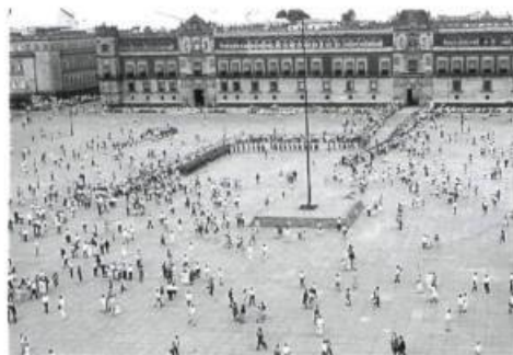
(HAUT) René Derouin, Migrations , 1992. Détail de l'installation au Musée du Québec en septembre 1992.