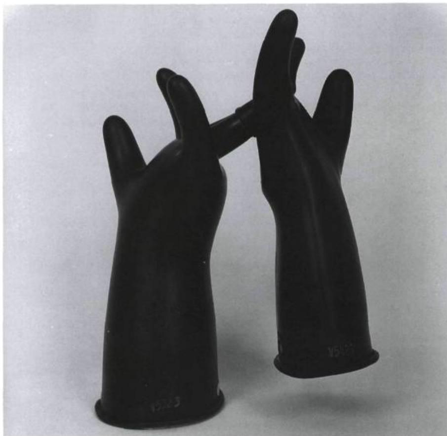
Stephen Schofield, Hung Pocket , 1990.

dans ce cas «les sensations réelles, kinesthésiques et tactiles forment un tout avec les impressions vestibulaires et optiques». En effet, bien qu'elle soit couchée Olympia est en attention perceptuelle et par conséquent malgré sa nudité et son immobilité, l'image corporelle n'est pas ici dispersée ou morcelée. Le point de vue est frontal et cette représentation du corps nous est donnée en distance "distance sociale" (E.T.Hall), une distance ni trop proximique ni trop lointaine de telle sorte que nous puissions percevoir l'ampleur totale du corps d'Olympia, des pieds à la tête, sans perdre de détails parce que trop proches ou trop loins d'elle. Notons toutefois que l'image du corps d'Olympia déborde de ce