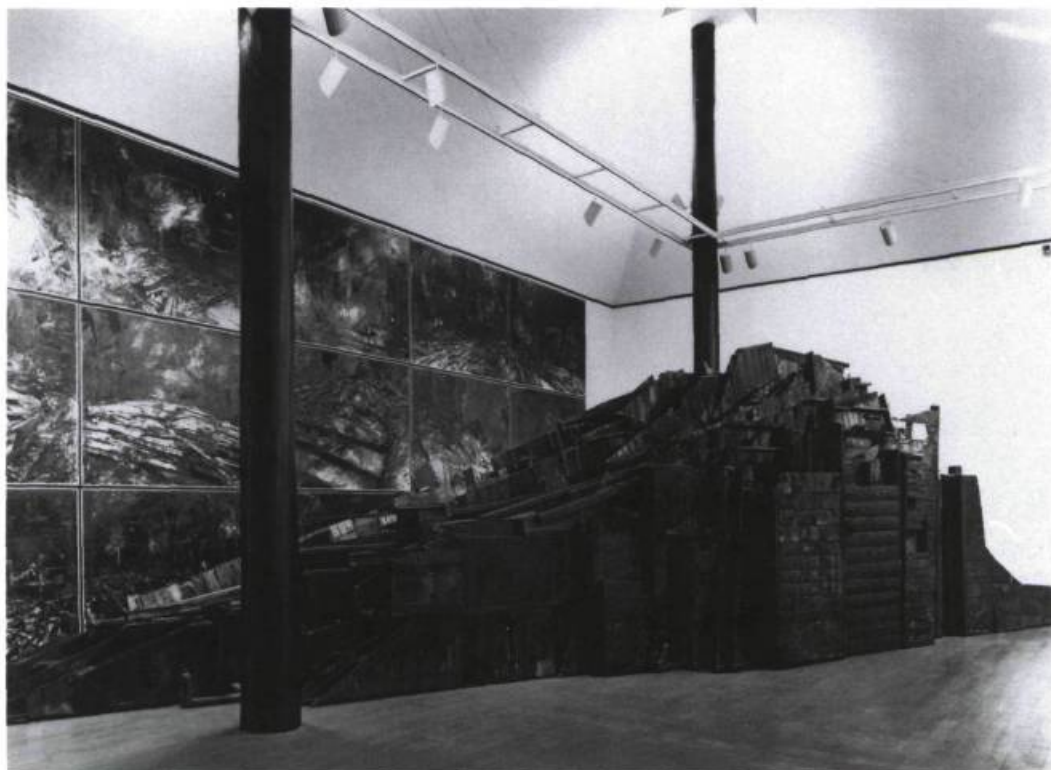
Kazuo Kenmochi, Untitled , 1990. Wood and paint, drawings (oil on photographs). 330 x 1260 x 280 cm.; drawings 498 x 1330 cm. A Primal Spirit: Ten Contemporary Japanese Sculptors . Collection Galerie Tokoro, Tokyo. Los Angeles County Museum of Art.

wise with natural resources. It was only in 1854, when Commodore Matthew C. Perry and the American fleet of Black Ships, with a show of force, convinced Japan to sign diplomatic agreements that led to the opening of Yokohama. Until then Japan had been in a state of splendid isolation for 250 years, perfecting and refining its cultural traditions. Soon after, Japonisme had invaded Europe, the Ukiyo-E (floating world) woodblock prints, textiles