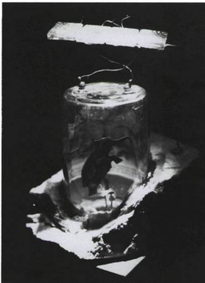
Réal Patry, Commentaire 321 , 1990. Matériaux mixtes motorisés. 30,4 x 20,3 x 20,3 cm.

et surmontés d'une burette à l'huile à long bec verseur. En pressant le levier de l'instrument, on actionne un moteur qui fait se mouvoir les jouets... déjà arrosés d'huile par l'artiste à en juger par leur coloration noirâtre. Curieuse métonymie plastique où l'effet (le gigotement que provoquerait un déversement du liquide sur des animaux vivants attachés aux marches) remplace la cause du phénomène (aucun liquide ne s'échappe)! Qui plus est, le bruit produit par le mécanisme s'apparente à une