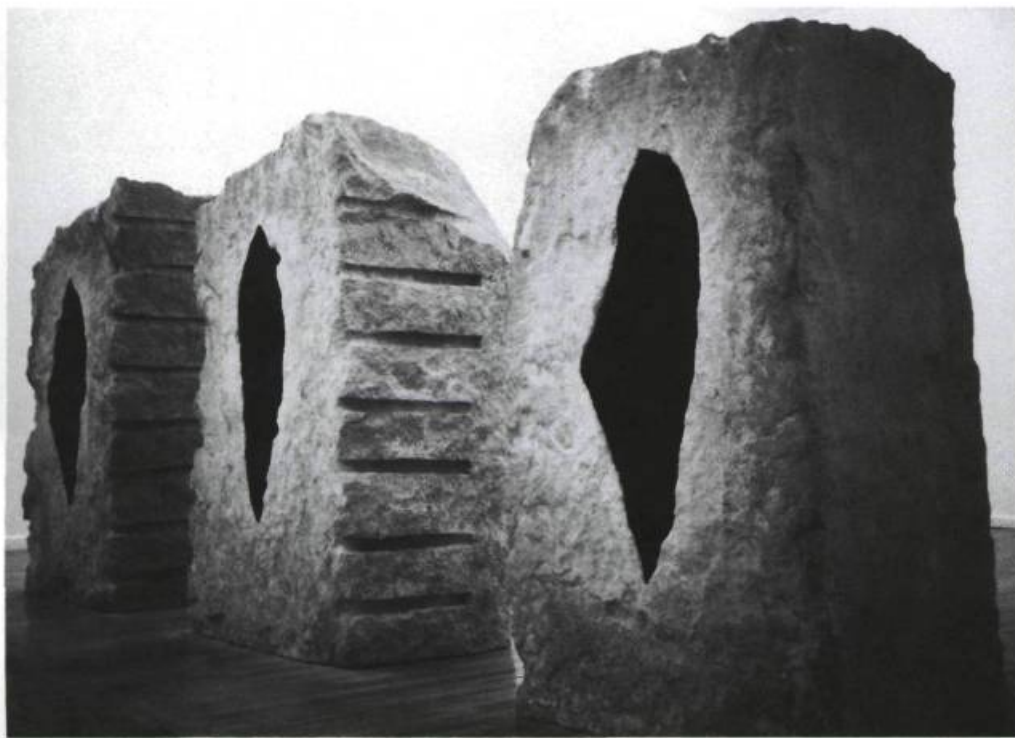
Anish Kapoor, Untitled , 1990. Pierre et pigment. Le Magasin, Centre français national d'Art contemporain de Grenoble.

Les critiques tentent déjà souvent de rattacher une production artistique à des critères qui devraient