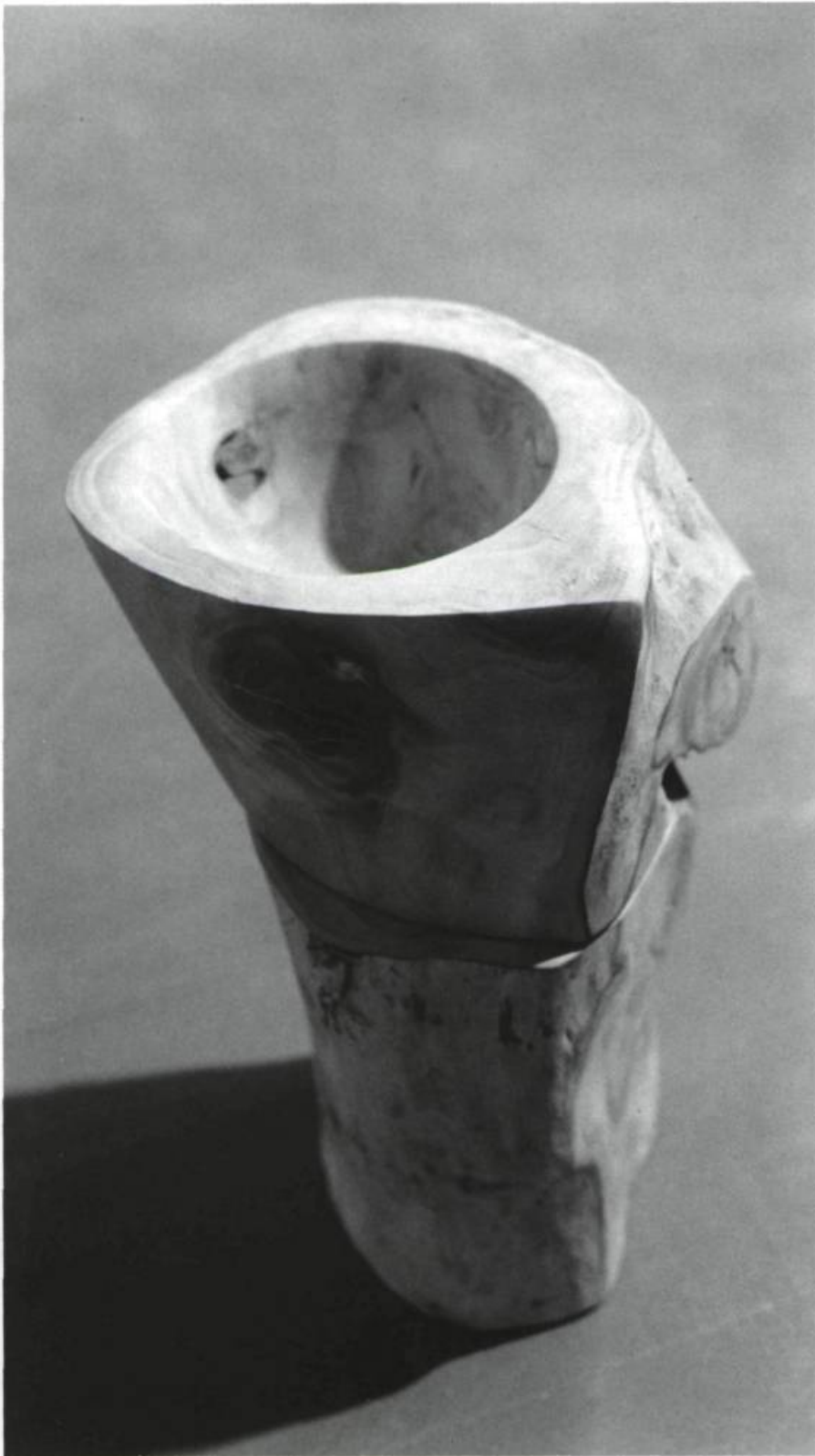
Natalie Roy, Bois , 1990. Bois. 28 x 17 x 19 cm.

fruits de cire blanchâtre, rosacée : pommes, citrons et poires tendres et lisses. Chairs jeunes et chairs abîmées, comme la vie et la mort indissolublement liées, réciproquement nécessaires : «Ce qui est intéressant surtout dans cet arbre, c'est cela. De ces moignons confirmés (de vieux infirmes, arthritiques) naissent des bouquets de premières communiantes ou de mariées. Du noirs retors, le blanc et le rose.» 2