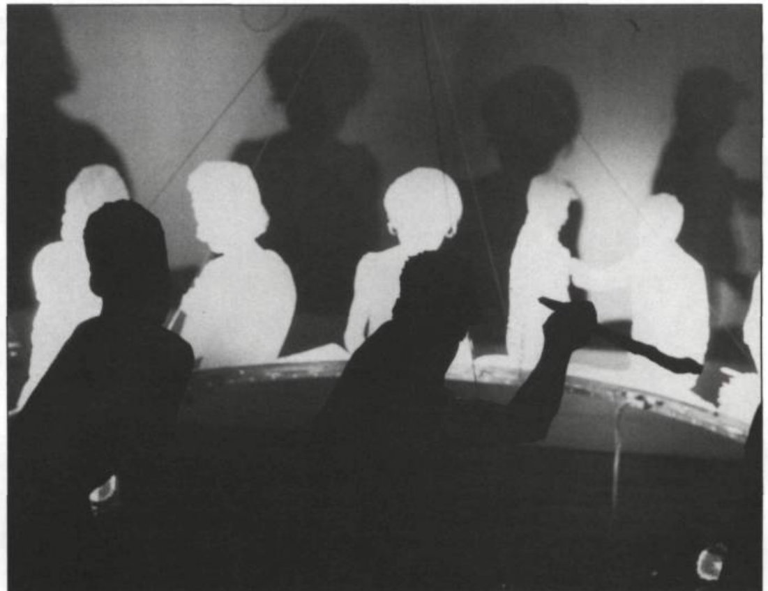
→ Guy Bourassa, Descriptions de descriptions , 1989.

Tôle galvanisée, six lampes halogènes, câble d'acier, transformateur. 175 x 60 cm.