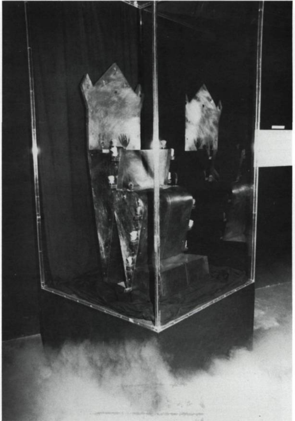
Daniel Hogue, L'Assomption du trône , 1989. Cuivre, plumes, supraconducteurs, aimants et azote. Sculpture exposée à la Cité des Arts et des Nouvelles Technologies de Montréal dans le cadre de "Image du futur 89".

La sculpture : j'ai voulu parler de façon ironique de rois déchus, enfermés, glacés dans le pouvoir qui les traque. De monarchies éclatées. D'un projet de musée qui a traversé les âges, reposant figé sous son enveloppe de verre. Du héros exemplaire moderne autrement maquillé : en révolutionnaire, en réformateur, en chef de parti. De l'homme de tous les jours face aux mythes du surhomme... Mais aussi de