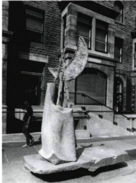
Serge Beaumont, Tentelune , 1989. Pierre de St-Marc. App. 10' x 4' x 4'.

ciale, dénonciatrice des marasmes écologiques causés par la folie militariste, sa sculpture-installation est un assemblage pouvant paraître à première vue hétéroclite, mais si chargé de sens que le tout devient rapidement homogène tant dans la forme intrinsèque de l'oeuvre que dans sa relation spatiale avec l'environnement urbain. Formée de multiples éléments de grandes dimensions reliés par des câbles en tension (parties de citernes, éléments de pylônes assemblés en arche) l'oeuvre s'étend, par un ensemble de plaques posées sur l'asphalte sur lesquelles les automobiles passent, jusque de l'autre côté de la rue. Véritable dazibao, la sculpture est ponctuée de textes peints sur l'acier: dénonciation exhaustive d'une trentaine des "industries de la mort" de la région métropolitaine, extraits d'un texte de Pierre Vallières faisant état de statistiques quant aux effets déplorables des dépenses militaires sur l'écologie; en