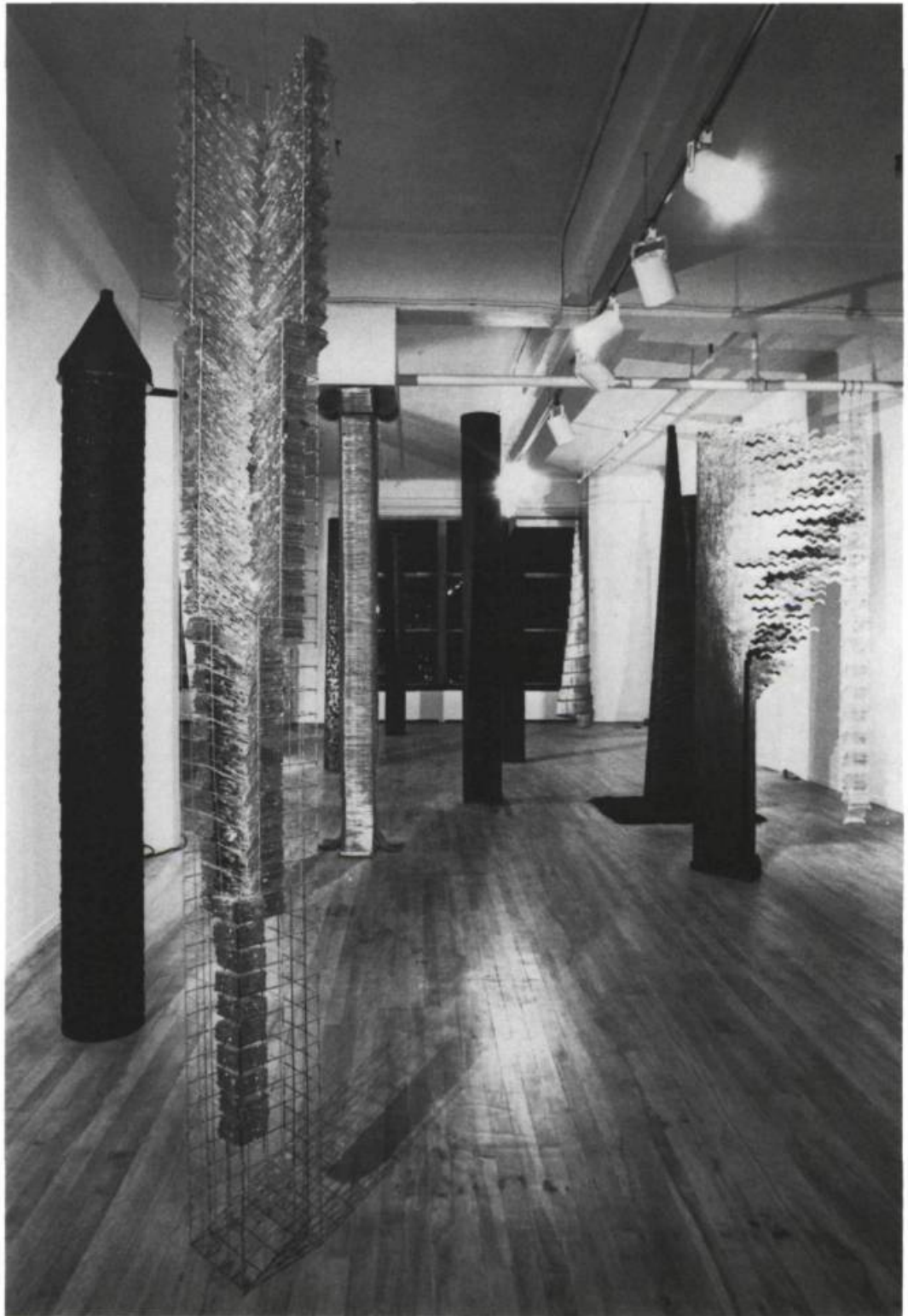
Vue de l'exposition Verticalités , Galerie Trois Points, 8 octobre-2 novembre 1988.