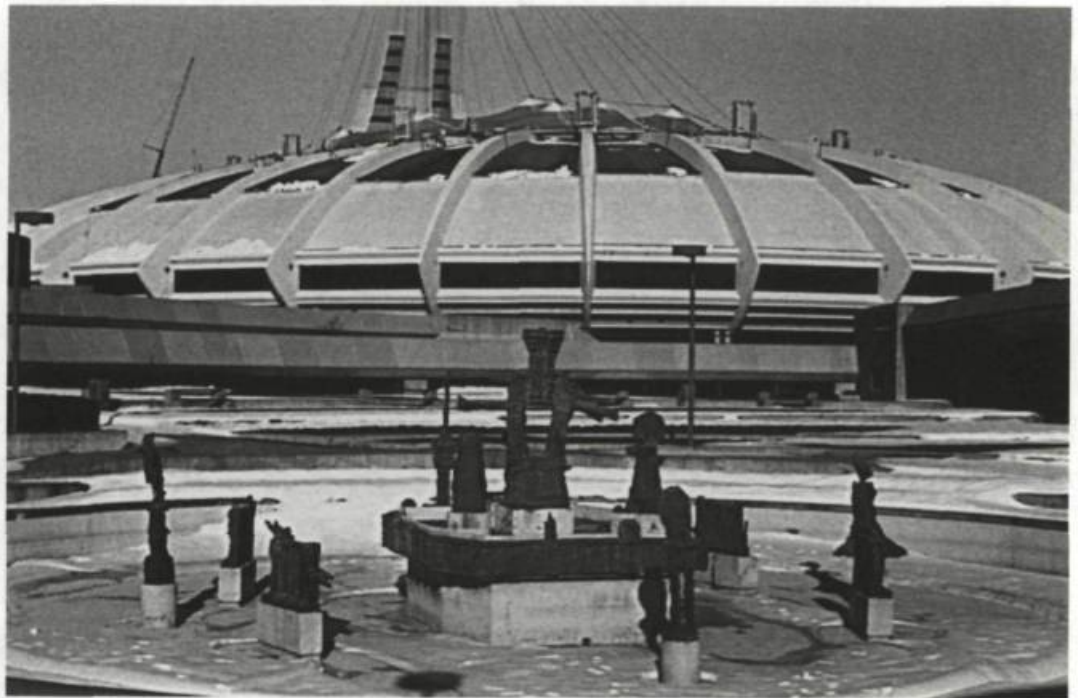
Jean-Paul Riopelle, La Joute . Stade olympique, Montréal.

Cette symbolique renvoie en général à des conditions humanistes représentant les valeurs fondamentales de la destinée de l'Homme, indépendamment de toute considération factuelle, alors qu'au siècle dernier, ces valeurs étaient incarnées à travers la