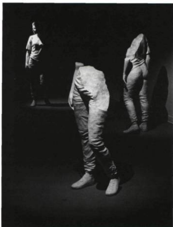
Jules Lasalle "Présence". (4 éléments). 1987 Fibre de verre. De 60 cm à 167 cm h. Prix: 6 400 $.