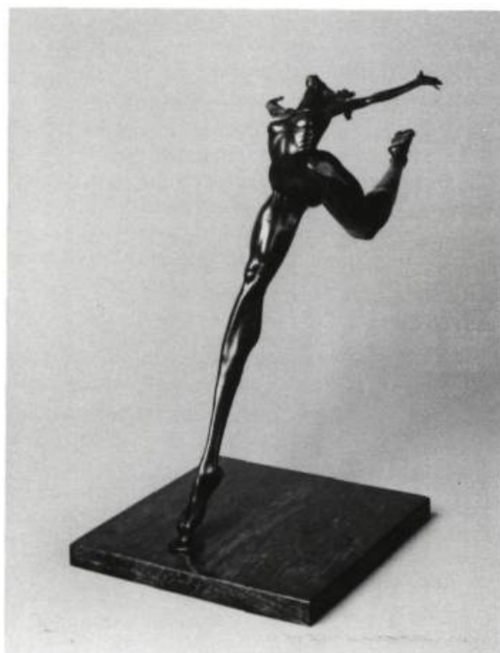
Donald Liardi "Alive". 1985 Bronze, édition de 12; 28" h. Prix: 7 350 $.

Vous pouvez acquérir ces sculptures par l'entremise d'ESPACE en communiquant avec la revue au 598-8982