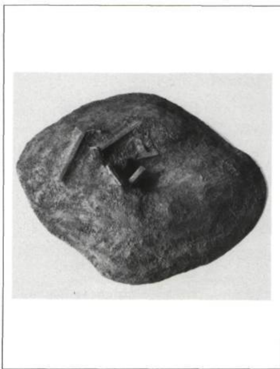
Luc Forget "20 089 matinées". 1988 Multi-médium: rasoirs Bic, ciment plastique. 14" diam. Prix: 700 $.