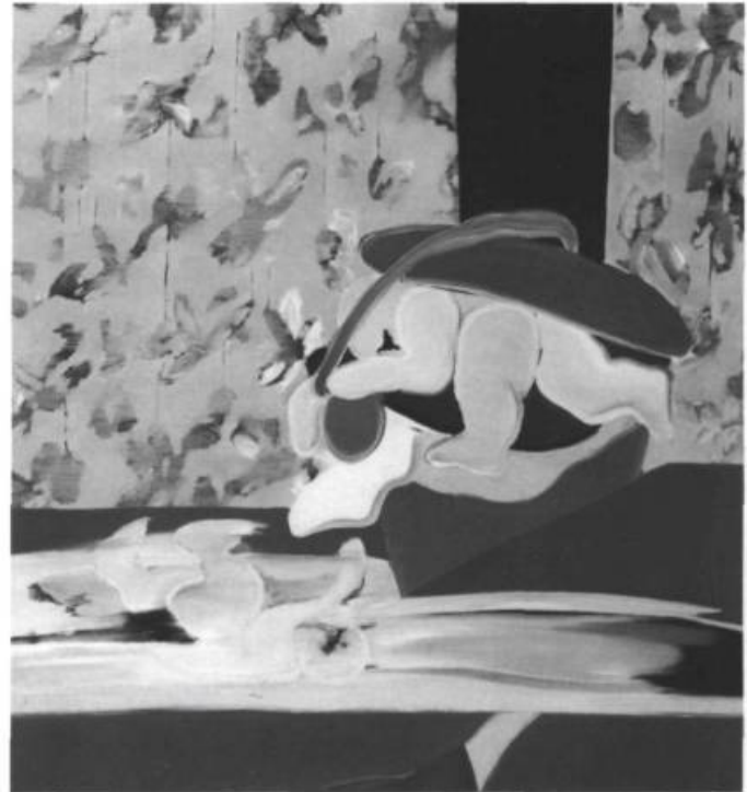
Yvone Duruz: Circonstance , 1977. Acrylique sur toile 118 x 103 cm. 2

Je suis entré dans le monde d'Yvone Duruz par cette échappée, ni fenêtre, ni porte, rupture franche plutôt, qui s'ouvre au fond d'un tableau peint en 1977, Circonstance , une acrylique sur toile. J'ai d'abord été appelé à cette oeuvre par le "papier peint" du fond où je retrouvais, amicaux et familiers les gris, les roses de Georges Braque. Puis comme entraîné hors de mes habitudes, arraché à mes admirations admises, j'ai été projeté, à mon esprit défendant, dans ce trou noir où une nuit violacée dresse le rectangle debout qui abolit le mur de mes résistances en y ouvrant toute l'ombre de l'inconnu, ombre vouée dans le tableau à ne rien continuer, lier, poursuivre mais plutôt à césurer, rompre et nocturnement interroger quelque, tout à fait nouvelle, manière d'être perdu. Elle est de cette nuit-là, la femme Duruz. Une nuit mythiquement profonde, une nuit de cosmogonie même aux surfaces peintes de l'oeuvre. Comment ne pas tenter de traduire cette grande noctuelle tout à coup effroyablement ouverte en moi, en changeant de registre de langage, en faisant appel aux voix plus intimes, plus soliloques de la poésie: