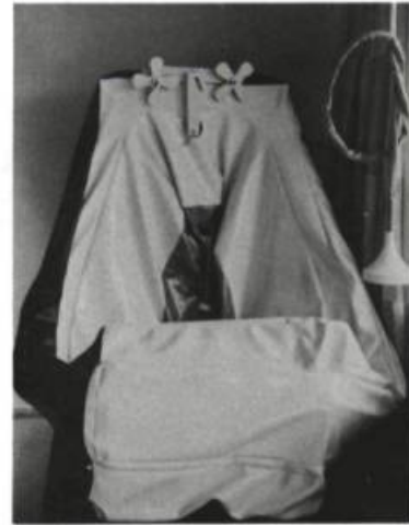
Soft Tub Claes Oldenburg