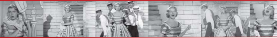
ROSEMARY CLOONEY INTERPRÉTANT UNE VERSION CHORÉGRAPHIÉE DE MAMBO ITALIANO EN 1954.

Le titre, Mambo Italiano , est emprunté à une chanson de Bob Merrill, écrite en 1954 et enregistrée la même année par Rosemary Clooney. Bien que plusieurs interprètes populaires l'aient reprise depuis, c'est la version originale qui a été utilisée dans pas moins de cinq films, dont Les sirènes ( Mermaids , 1990), où Cher la parodie dans sa cuisine.