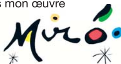
Joan Miró [1893-1983] artiste catalan du mouvement surréaliste

« On trouve très souvent des étoiles dans mon œuvre parce que je me promène souvent en pleine nuit, je rêve de ciels étoilés et de constellations, cela m'impressionne et cette échelle de l'évasion qui est très souvent mise en valeur dans mon œuvre représente une envolée vers l'infini, vers le ciel en quittant la terre. »