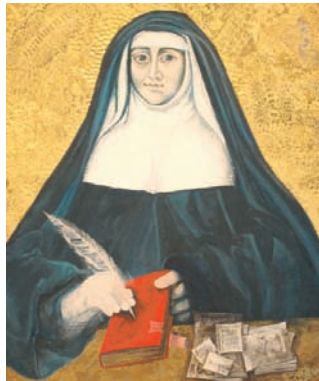
Marie de l'Incarnation