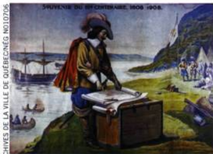
SOURCE : SOUVENIR DU 100 e CENTENAIRE, 1868-1908. CHAMPLAIN TRACANT LE PLAN DE QUÉBEC (GRAVURE), (CA. 1908)

L'exposition Foules d'archives ouvre pour la première fois les riches fonds des Archives de la ville de Québec et s'accompagne de plusieurs activités sur l'histoire de la capitale. À l'initiative de l'Institut canadien de Québec, et en lien avec le 400 e , cette exposition-événement se tiendra à la bibliothèque Saint-Jean-Baptiste, sur le site patrimonial du Parc-de-l'Artillerie, ainsi que