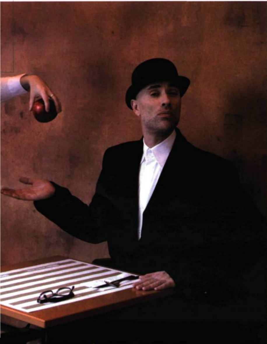
ASSISTANTE : MAUDE CHALUVIN / MAQUILLAGE : CYNTHIA VAILLANT

J.H. : Oui, mais les personnages de commissaires sont tous un peu des antihéros, fatalement. On ne peut plus inventer de flics « héros », ça ne passerait